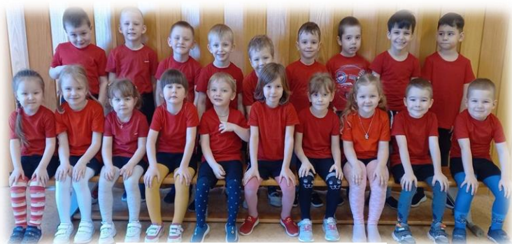
Средняя группа №1 "Ягодка"