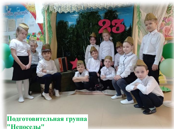
Подготовительная группа "Непоседы"

Поздравление с 23 февраля от подготовительной группы «Непоседы», можно посмотреть по ссылке: https://youtu.be/rSNW_TvLZS4