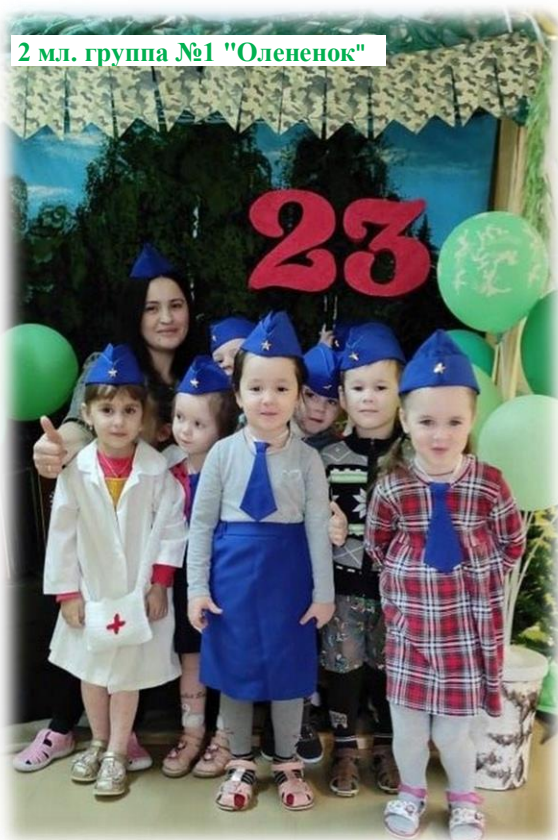
2 мл. группа №1 "Олененок"