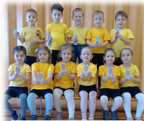
Средняя группа №2 "Смешарики"

В каждой группе дети вместе с воспитателями выполнили подарки для пап и дедушек.